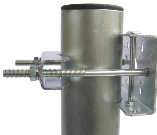
montáž na trubku s \varnothing 90mm